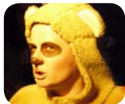
L'Odyssée du Jouet

Les comédiens virevoltent de salle en salle entraînant les visiteurs dans la découverte de l'exposition. Les visites théâtralisées apportent une note légère et divertissante au public. Elles confèrent à l'exposition un éclairage décalé tout en restant fidèle au contenu artistique et/ou thématique. Elles synthétisent de manière ludique les notions, les connaissances historiques, scientifiques ou de tout autre genre, liées à l'exposition.